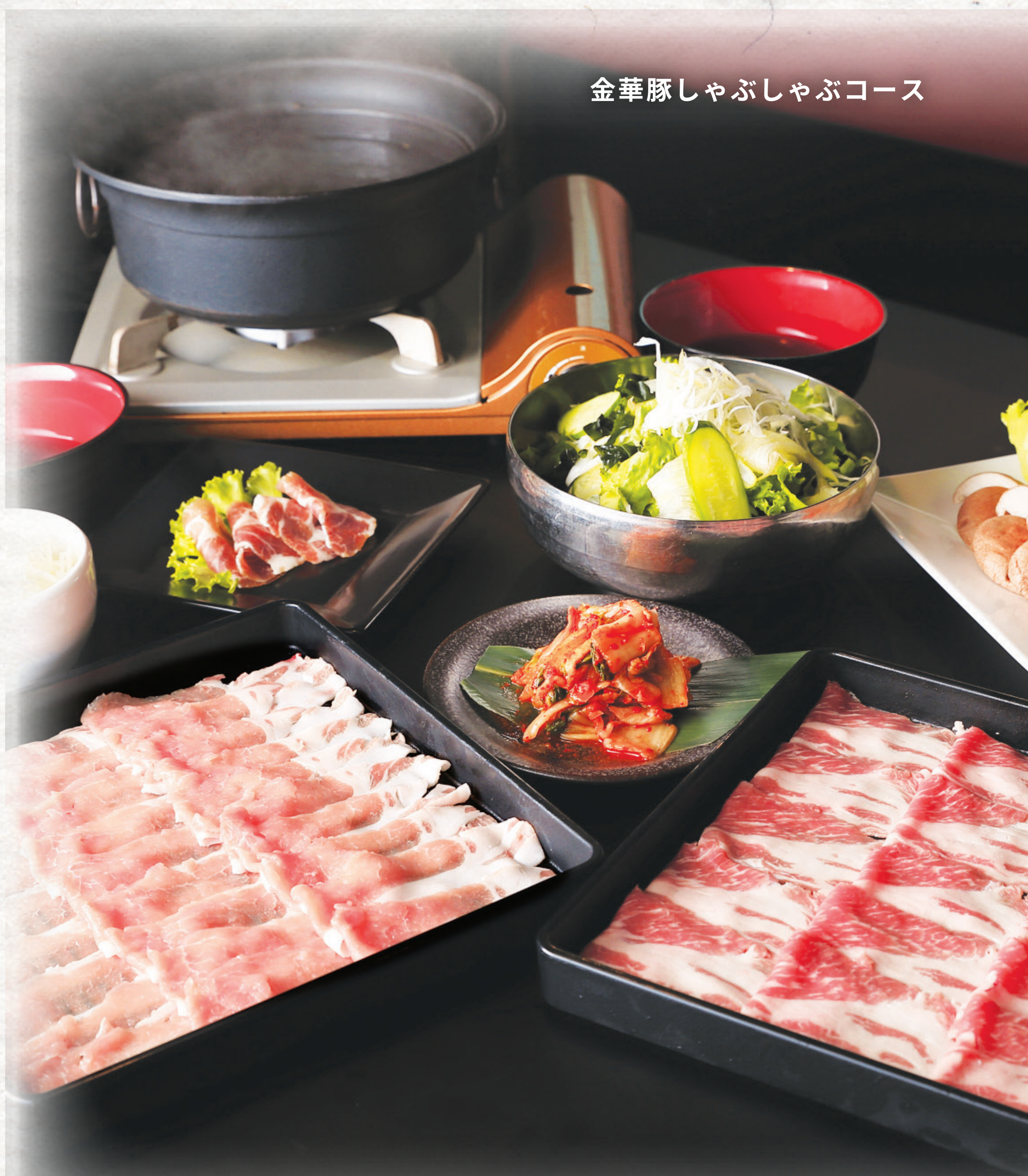
金華豚しゃぶしゃぶコース