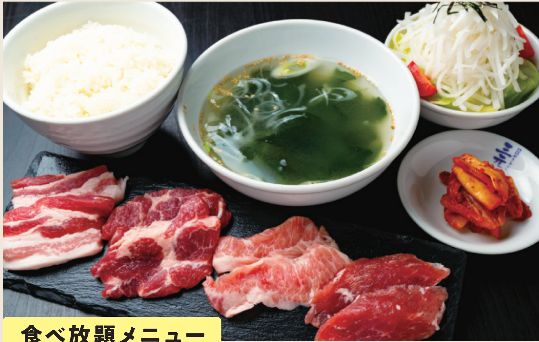
食べ放題メニュー